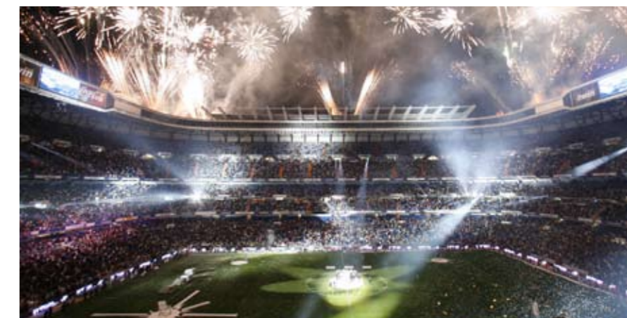
Stadion Santiago Bernabeu in Madrid

onder wiens auspiciën het Peace Cup toernooi plaatsvindt, maakt duidelijk dat alle inkomsten van het toernooi uit o.a. televisiecontracten, recettes en marketing gedoneerd worden aan sociale hulpverleningsprojecten voor jongeren wereldwijd.