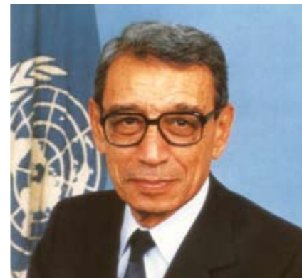
dr. Boutros Boutros-Ghali tijdens zijn ambtsperiode bij de VN