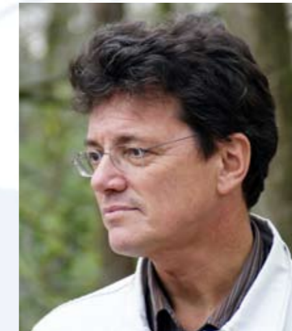
Willie Smits, bosbouwkundige en natuurbeschermer

bereid was land af te staan kreeg een baan in het constructiewerk, de landbouw, de verzorging van de orang-oetans of de verkoop van de landbouwproducten. Nu is er een bloeiende economie, een vruchtbaar landschap en een veelvoud aan diersoorten. Dit soort initiatieven zijn vandaag de dag van levensbelang.