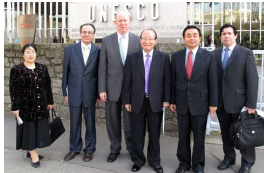
Het UPF team voor het UNESCO gebouw in Parijs

Hij benadrukte: "Het belangrijkste is de globalisering, de opkomst van een wereldwijde burgermaatschappij. Tenzij we de globalisering democratiseren zal er geen vrede zijn. En dit moet gebeuren door de wil en de daadkracht van u allen, zoals u hier vanavond bijeen bent. De gewenste democratisering van de globalisering zal alleen plaats vinden indien we ons allemaal persoonlijk verantwoordelijk voelen". De aanwezige ambassadeurs, wetenschappers, religieuze leiders en NGO bestuurders