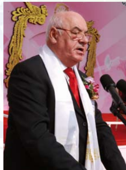
Dr. Alfred Moisiu, voormalig president van Albanië (2002-2007)

Daags na de ceremonie sprak reverend dr. Moon de driedaagse 'International Leadership Conference' toe, waaraan 250 internationale leiders deelnamen. Deze ervaren en invloedrijke mannen en vrouwen maakten ook allen deel uit van de huwelijksceremonie een dag eerder, de meesten samen met hun partner, enkelen droegen een foto van hun partner. Thema van de conferentie was: 'Marriage and Family as an Instrument of Peace.' Dr. Moon: "De mensheid gaat nu een nieuw tijdperk binnen, waarin Gods liefde en 'hart' steeds beter voelbaar worden. Het is een nieuwe tijd waarin wij als verlichte mensen volgens ons geweten zullen leven, aangestuurd door 'natural reason' en gebaseerd op Gods oorspronkelijk plan". ■