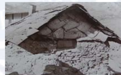
De eerste kerk die rev. Moon bouwde van door VN troepen achtergelaten afvalmateriaal, Korea 1950

Over zijn vroege kinderjaren schrijft hij: "Als kind was ik bijna altijd buiten in de natuur, in de bossen en de heuvels rond mijn ouderlijk huis. Vaak viel ik na een dag lang spelen buiten op het veld in slaap en moest mijn vader mij komen zoeken. Wanneer ik hem mijn naam hoorde roepen in de verte, glimlachte ik, zelfs in mijn slaap. Door het geluid van zijn stem werd ik wakker maar ik deed alsof ik nog sliep, waarna hij me op zijn rug hees en me naar huis droeg. Wanneer mijn vader me dan zo op zijn rug de heuvel af droeg op weg naar huis, had ik het gevoel volledig geborgen en veilig te zijn en dat was voor mij vrede."