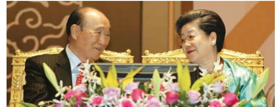
Het echtpaar Sun Myung Moon en Hak Ja Han Moon

De acht hoofdstukken van Sun Myung Moon's autobiografie vertellen over zijn jeugd en opvoeding en zijn religieuze roeping, gevolgd door het stichten van een kerk en de groei van zijn schare volgelingen in de schaduw van de Koreaanse oorlog. We lezen hoe hij zijn twee jaar en acht maanden in het vernietigingskamp van Heungnam overleefde. Na zijn bevrijding door VN troepen vluchtte hij niet direct naar het veilige zuiden, eerst ging hij terug naar Pjongjang, het 'Jeruzalem van het oosten', om zijn volgelingen te verzamelen.