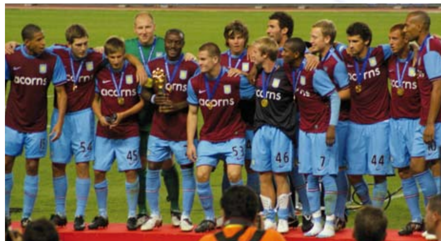
Kampioen Aston Villa met de Peace Cup

treffen met dit jaar ook deelnemers als Olympique Lyonnais, FC Porto en Atlanta (Mexico), naast teams uit Saoedi-Arabië, Ecuador en Korea. In 2009 werd het toernooi voor de eerste keer buiten bakermat Zuid Korea gehouden. Alle inkomsten van het toernooi